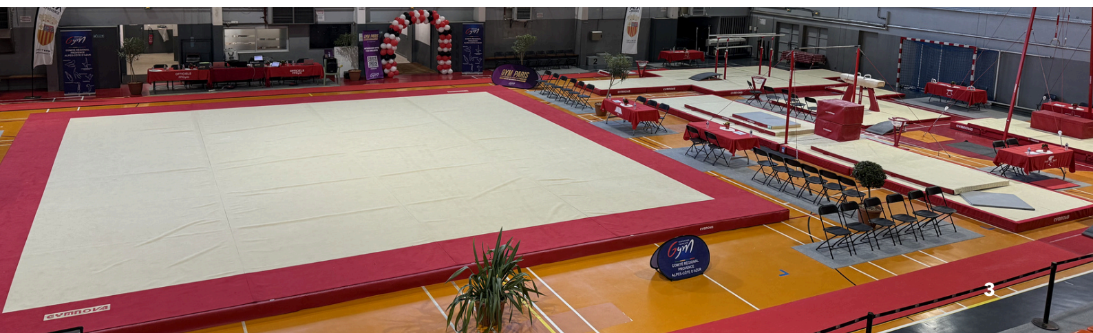
Liste des thématiques